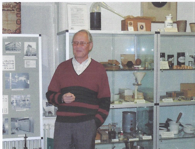
Från besöket på Medicinhistoriska museet i Uppsala.

Samtliga i styrelsen kan nås på info@enecopiaslaktforskare.se